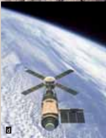
a. Satélite Sputnik b. Portada con la llegada de Yuri Gagarin al espacio. c. Pisada de Buzz Aldrin en la Luna (Apolo XI) d. Estación espacial Skylab.