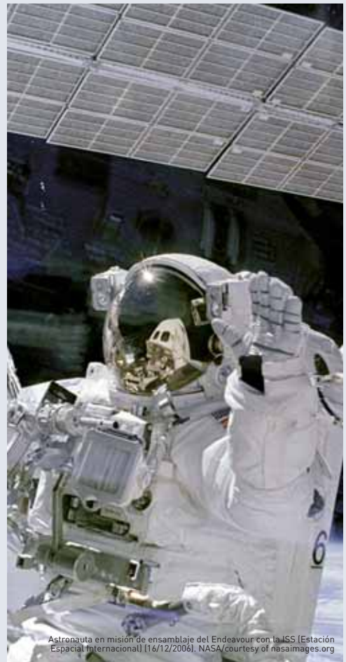
Astronauta en misión de ensamblaje del Endeavour con la ISS [Estación Espacial Internacional] (16/12/2006).

EEUU tiene una política y una vocación clarísima de liderazgo en la carrera espacial, aunque en ciertas materias se opte por la cooperación.