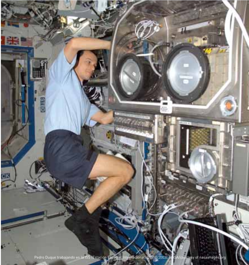
Pedro Duque trabajando en la ISS (Estación Espacial Internacional) (27/10/2003).