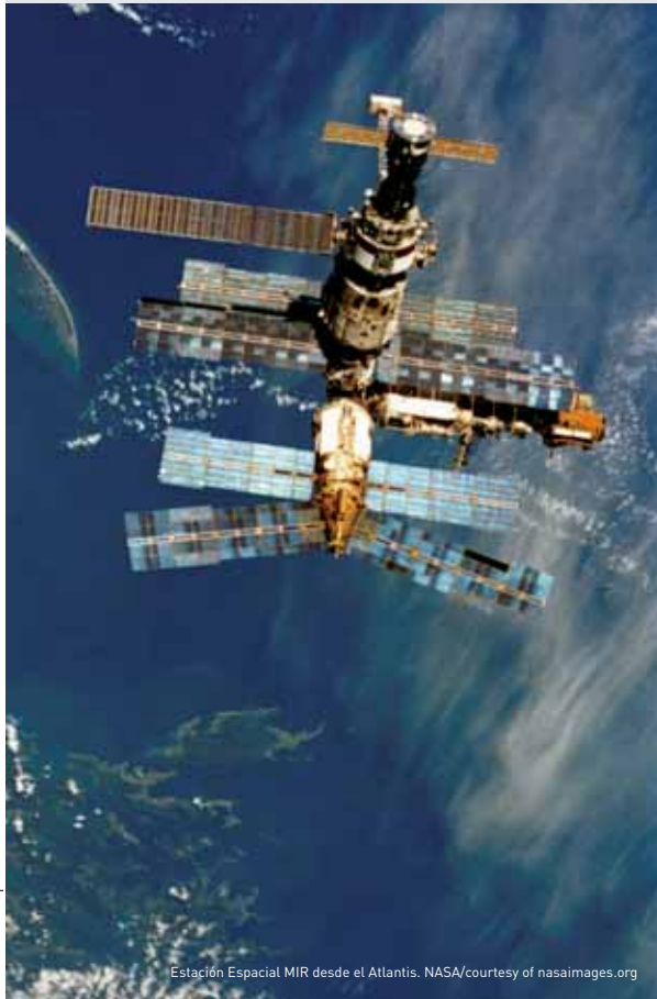
Estación Espacial MIR desde el Atlantis.

el Atlántico en un pequeño barco velero. Tendríamos escasez de espacio. Hay unas necesidades específicas de estrecha convivencia que atender, así como problemas de adaptación de unos a otros.