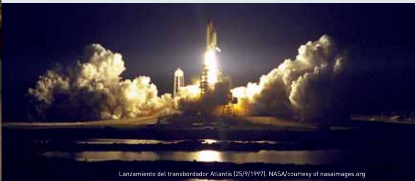
Lanzamiento del transbordador Atlantis (25/9/1997).

Director General de Deimos Imaging y astronauta en excedencia de la ESA (Agencia Espacial Europea)