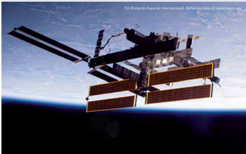
ISS (Estación Espacial Internacional).

toridades que realizan la selección se lo comunican primero a las autoridades de los gobiernos, y luego a los interesados. Hay tantas personas involucradas que las noticias terminan por filtrarse.