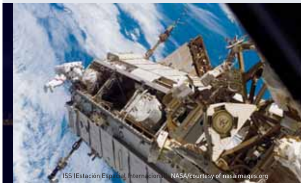
ISS (Estación Espacial Internacional)