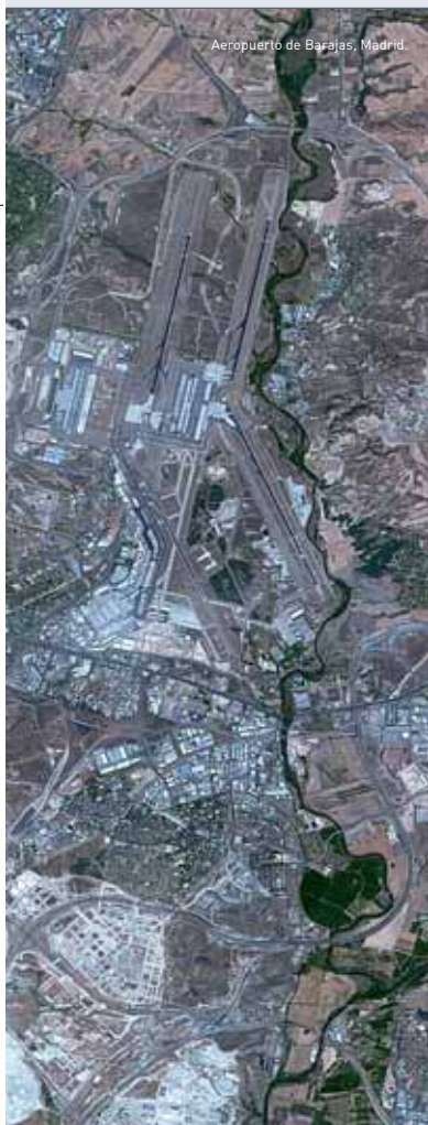
Aeropuerto de Barajas, Madrid.

Viajé al espacio por primera vez el 29 de octubre de 1998. Antes estuve más de un año en Rusia. Viví en la Ciudad de las Estrellas, un pequeño pueblo de 5.000 residentes totalmente enfocado al espacio, con sus técnicos, ingenieros y centros de entrenamiento. Cuenta con restaurantes, colegios, cines, todo lo necesario para hacer la vida agradable a los que allí viven, porque esa ciudad era producto de la planificación soviética, que en cuestiones del espacio era autárquica.